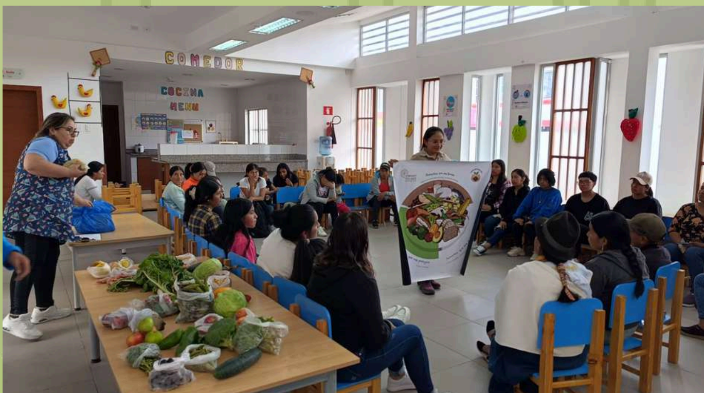
Taller de consumo responsable en el centro de Desarrollo Infantil pertenecientes a la Parroquia de Imantag.