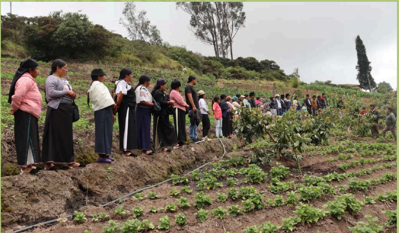
Las giras de observación tienen como objetivo fomentar el intercambio de conocimiento, adopción de prácticas sostenibles y generar lazos de confianza entre agricultores. Comunidades de Quiroga en Pimampiro .

Las nuevas familias vinculadas al proyecto pertenecen al pueblo Kichua Cotacachi, quienes perciben en el proceso como novedoso y una oportunidad para el rescate y fortalecimiento de técnicas y tradiciones que se han ido desplazando, por las practicas de agricultura convencional.