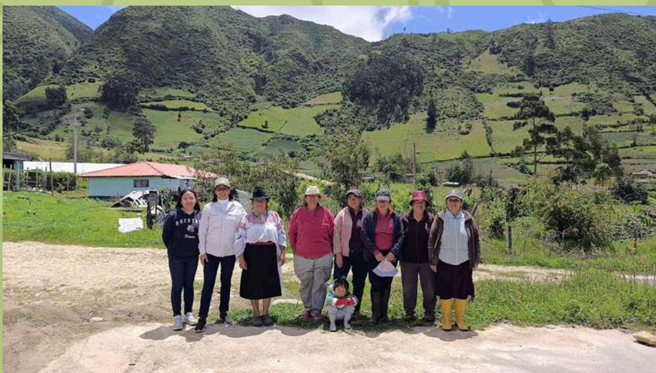
Participación del Grupo Caminando Hacia el Futuro de Puetaquí en la construcción de la propuesta para el premio Benoit María , en la comunidad de Puetaquí-Mariano Acosta.