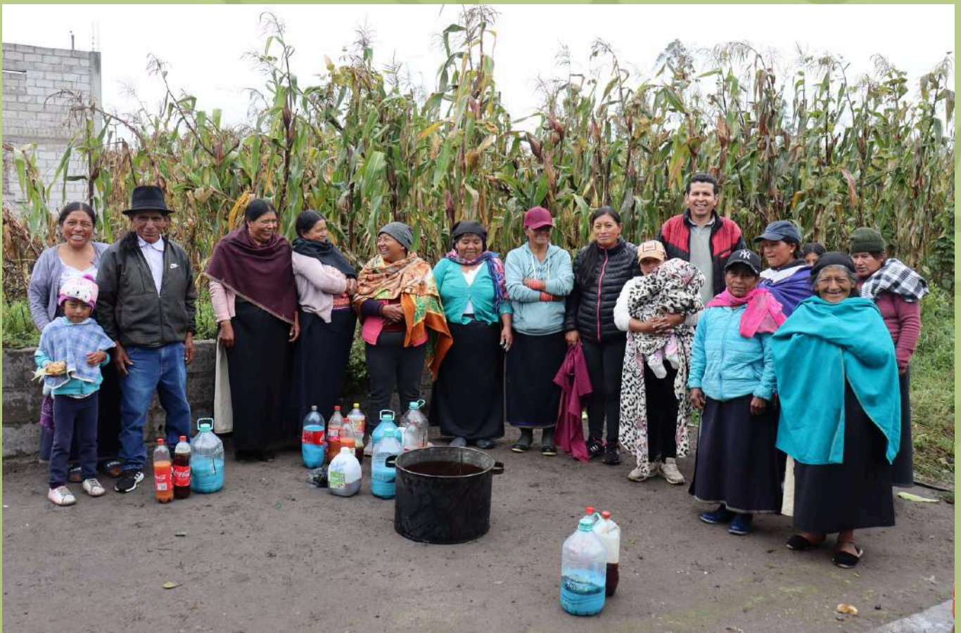
Comunidad de Niño Jesús-Cotacachi preparando caldos minerales, para luego ser aplicados en los huertos de hortalizas implementados.

Continuamos trabajando en el monitoreo agroclimático participativo, realizando el registro de los pachagramas en comunidades de año 3 y en las nuevas se inició con el taller de manejo, actualmente hay 12 pachagramas (nuevos folletos) entregados en 7 comunidades, además se instaló 3 estaciones meteorológicas en 3 comunidades estratégicas.