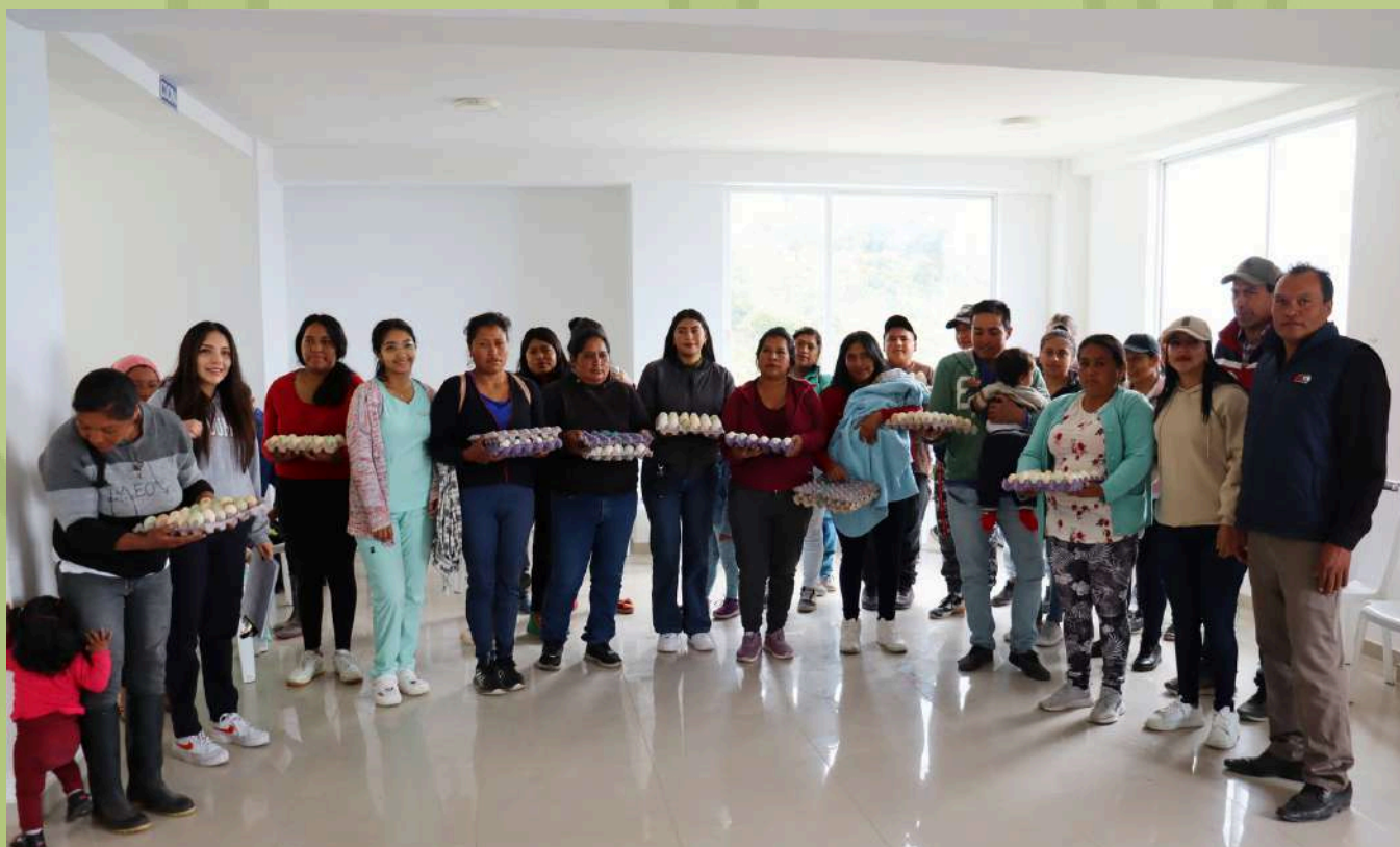
La importancia de la ingesta de proteína en niños menores de dos años es determinante para su desarrollo, Entrega de huevos a madres del Plan Piloto Nutriendo con Huevos Andinos en la parroquia de Chuga.

Durante este año, estos dos últimos talleres han receptado a 50 niños menores de 2 años por parroquia, causando un gran impacto y conciencia sobre la importancia de la alimentación para tener una vida más saludable. En Ecuador, el 48% de la población no puede acceder a una dieta balanceada y equilibrada ocasionando que la mayor ingesta de alimentos sea de carbohidratos y bebidas azucaradas; mismas que llevan problemas como sobrepeso y enfermedades crónicas no transmisibles como las obstrucciones cardiovasculares, diabetes e hipertensión