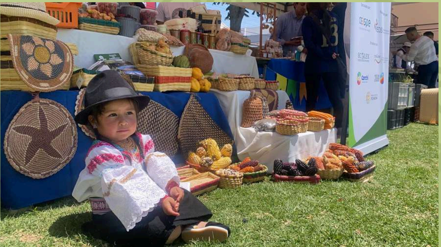
Delegación de la casa de semillas " Ñukanchi Muyupa Wasi " de Puetaquí, participaron en el intercambio de semillas al sur de la capital ecuatoriana.

Se ha participado con comunidades que son guardianas de la agrobiodiversidad en varios espacios, lo que ha permitido el intercambio y la venta de semillas; conocemos el potencial de las comunidades lo que hará que tengan una buena participación debido a su alto potencial de material genético.