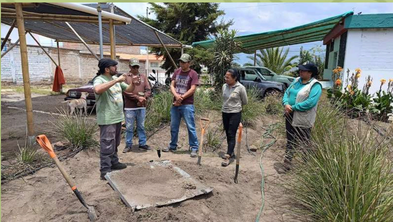
Participación del equipo técnico de campo en taller de inducción a la conservación de suelos.

Estas actividades son importantes porque permite adquirir nuevos conocimientos para el desarrollo integral de la organización, facilita adaptación al cambio, fomenta la innovación y promueve un crecimiento sostenible y equitativo.